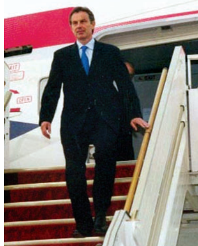
ECONOMY Blair fa il risparmiatore

Il premier laburista britannico, ha apparso un inesorabile cronista del Daily Telegraph, ha fatto spendere ai contribuenti del Regno Unito nell'arco dei nove anni in cui è stato al vertice del governo, 130mila sterline (circa 200mila euro) per le sue ferie. Un conto salato, che comprende l'uso per sé e per la numerosa famiglia (moglie, quattro figli e talvolta anche